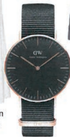
Uhr mit Nato-Armband von Daniel Wellington, 140 Euro.