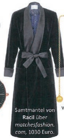
Samtmantel von Racil über matchesfashion.com, 1030 Euro.