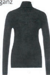
Rollkragenspullover von Marc Cain, 200 Euro.