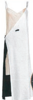
Slipdress von DKNY über Stylebop, 620 Euro.