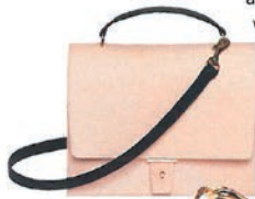
Umhängetasche aus Rindsleder von PB 0110, 800 Euro.

... dezente Farben und ein Hauch von Eleganz