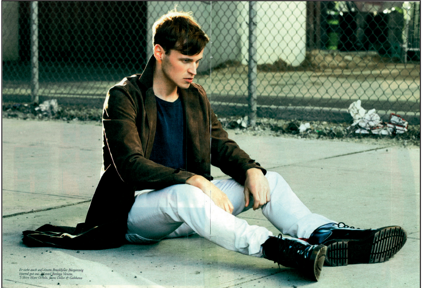
Er sieht auch auf einem Brooklyn's Bürgersteig überall gut aus. Mantel: Bottega Veneta, T-Shirt: Marc O'Plato, Jeans: Dolce & Gabbana

Ausgabe: 09 Seite: diverse Auflage: 650.000